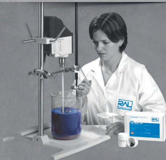
ILLUSTRATION TEST POSITIF

Dans une suspension de prise d'essai, ajouter une dose de solution de bleu de méthylène. Puis, prélevez à l'aide d'une baguette de verre, une goutte de la suspension, la déposer sur un papier filtre et renouvelez l'opération (dose + prélèvement n fois) jusqu'à l'apparition d'une auréole bleutée autour de la tache.